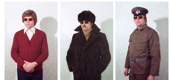
Simon Menner Images from the Secret Stasi Archives, 2011–13 From the series From a Seminar on Disguises Chromogenic print, framed 120 x 90 cm

Simon Menner was born in 1978 in Emmendingen; he lives and works in Berlin. He holds a master's degree in fine arts from the Berlin University of the Arts (2007), and has exhibited his works in solo and group exhibitions in various art institutions and festivals, such as the Arbeit Gallery in London (2015), the Goethe-Institut in Prague (2014), the Copenhagen Photo Festival (2014), the Museum of Contemporary Photography in Chicago (2014), the Open Society Foundation in Washington, D.C. (2014), the Grand Palais in Paris (2013), the Aperture Gallery in New York (2013), and the Grand Curtius in Liège (2013). He has received many awards, such as the Working Grant from the German Kunstfonds Foundation in 2014, the Lotto Brandenburg Photography Award in 2011, and the Paul Huf Award in 2010. His publication Top Secret – Images from the Stasi Archives was nominated for the First PhotoBook Award by Paris Photo-Aperture Foundation in 2013.