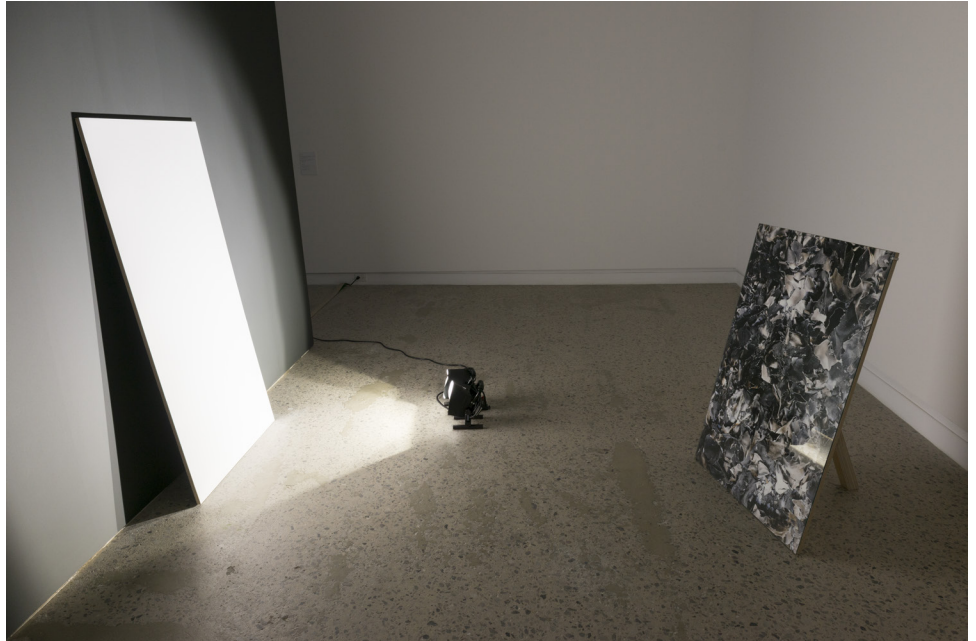
Claire Hannicq, Ashes (détail), 2014 Installation in situ . Impression jet d'encre, verre, éclairage industriel, contreplaqué

Ashes condense plusieurs strates de temps et d'interventions. Après avoir brûlé un tirage photographique, Claire Hannicq le réinsère dans une installation munie d'un dispositif lumineux qui en modifie la perception. L'artiste nous confronte ainsi à la destruction matérielle de l'image mise en scène dans un geste iconoclaste.