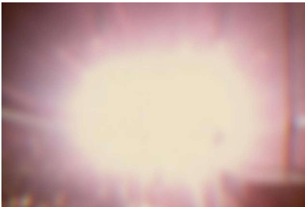
Alana Riley, Dans la lumière (Voici ce à quoi ressemble 500,000 watts de son et lumière combiné à plus de quarante motocyclettes en marche) , 2011 Vidéo couleur, 24 sec en boucle

Alana Riley retourne la caméra numérique face à une source lumineuse afin de produire une image liminale aux limites de l'abstraction. Elle génère un effet d'éblouissement qui altère momentanément la vision et fait disparaître le sujet à l'écran. La vidéo ne révèle que le geste de capter la lumière par le biais d'une image qui s'anime au rythme de la pulsation lumineuse.