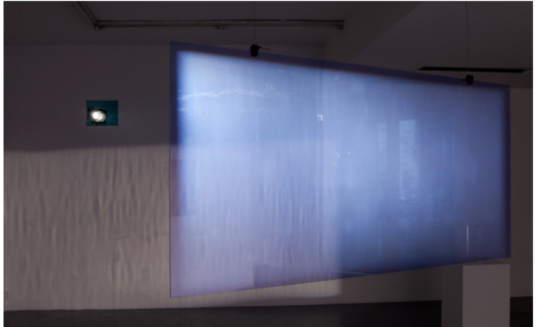
Julien Discrit, Décalques / Ciel voilé et soleil couchant d'un après-midi d'été, sur les bords du fleuve Saint-Laurent, près d'une pile du pont Jacques Cartier, le 27 juillet 2015 à 19h58, 2015 Vue de l'installation. Photo : Julien Discrit Avec l'aimable permission de l'artiste

L'installation Décalques est la transcription lumineuse d'un temps et d'un lieu précis. L'artiste prélève un instant à partir de données collectées le 27 juillet 2015 à 19h58 sur la rive du fleuve Saint-Laurent à l'aide d'un spectromètre. Ces informations permettent ensuite de reproduire avec exactitude la lumière ambiante grâce à un verre coloré. Image sans image, Décalques conserve de la photographie uniquement son geste originel, celui de la capture de la lumière.